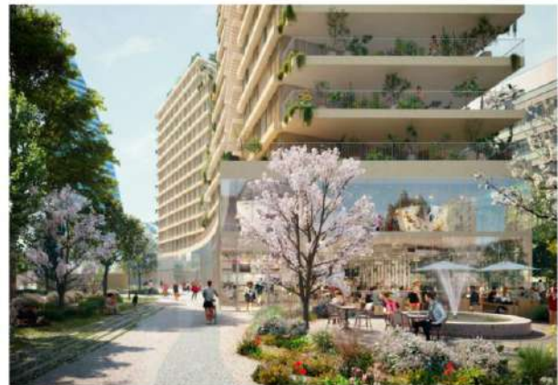
Perspective Projet Synapses

Le projet prévoit le maintien de la maison associative dédiée aux personnes atteintes de la maladie d'Alzheimer à son emplacement actuel. Le paysagiste WALD et le spécialiste en art urbain Quai 36 profiteront du vaste chantier pour repenser son environnement direct. Les différentes animations programmatiques et urbaines de Synapses ont pour objectif également de réactiver le quotidien de ces personnes touchées par la maladie.