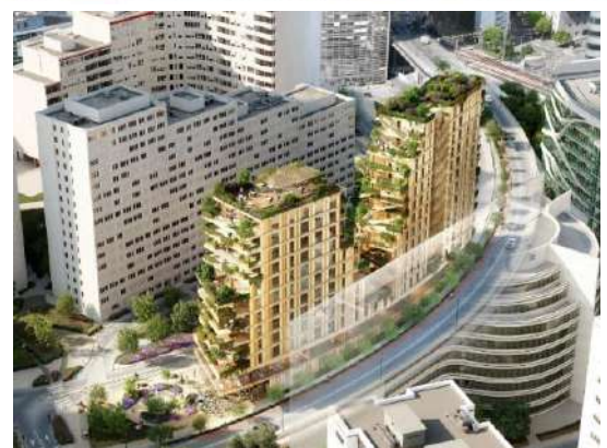
Perspective Projet Synapses