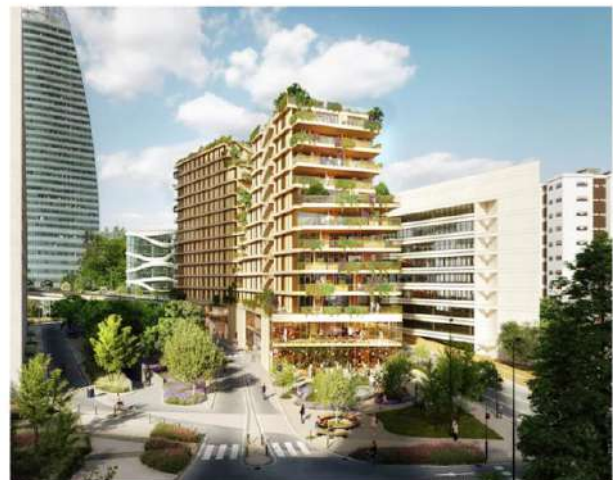
Perspective Projet Synapses