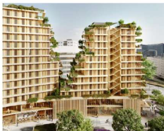
Perspective Projet Synapses – Crédit Diorama