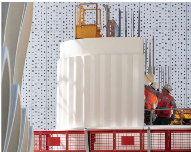
Élément d'angle préfabriqué - ©Lisa Ricciotti

M99 : avec 600 éléments préfabriqués en béton, le Groupe Constructa fait le choix de la préfabrication hors site de grande ampleur.