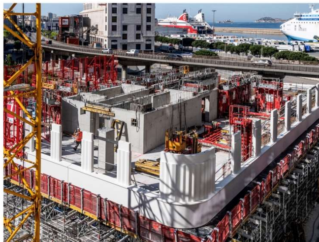
Avancée du chantier - Juin 2026

À Marseille, le chantier de la tour résidentielle M99 avance et franchit une étape majeure.