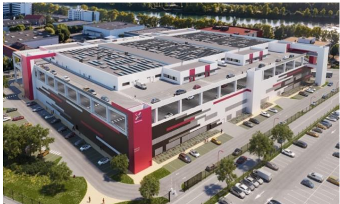
Le futur bâtiment Cadences , à Bezons, en bord de Seine

À Bezons, dans le Val-d'Oise, Virtuo développe en partenariat avec CBRE IM, Cadences , une opération de démolition-reconstruction visant à redonner vie à un terrain de 3,8 hectares où se trouvaient cinq anciens entrepôts et locaux désaffectés. Au regard des besoins exprimés par les entreprises, le site s'était révélé particulièrement adapté pour accueillir :